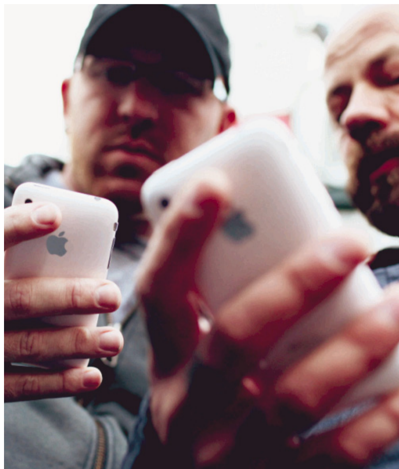
Zeig mir deine Apps, und ich sag dir, wer du bist.

Programmieren ist eine Sache, eine App erfolgreich vermarkten eine andere. Bringt das ein Einmannbetrieb heute beides noch hin? Ja, immerhin bin ich ja selber ein Einmannbetrieb. Sicher haben Teams von Spezialisten mindestens ebenso gute Chancen auf Erfolg. Ich wünsche mir aber, es gäbe noch viel mehr erfolgreiche Einmannbetriebe, die sind mir sympathischer.